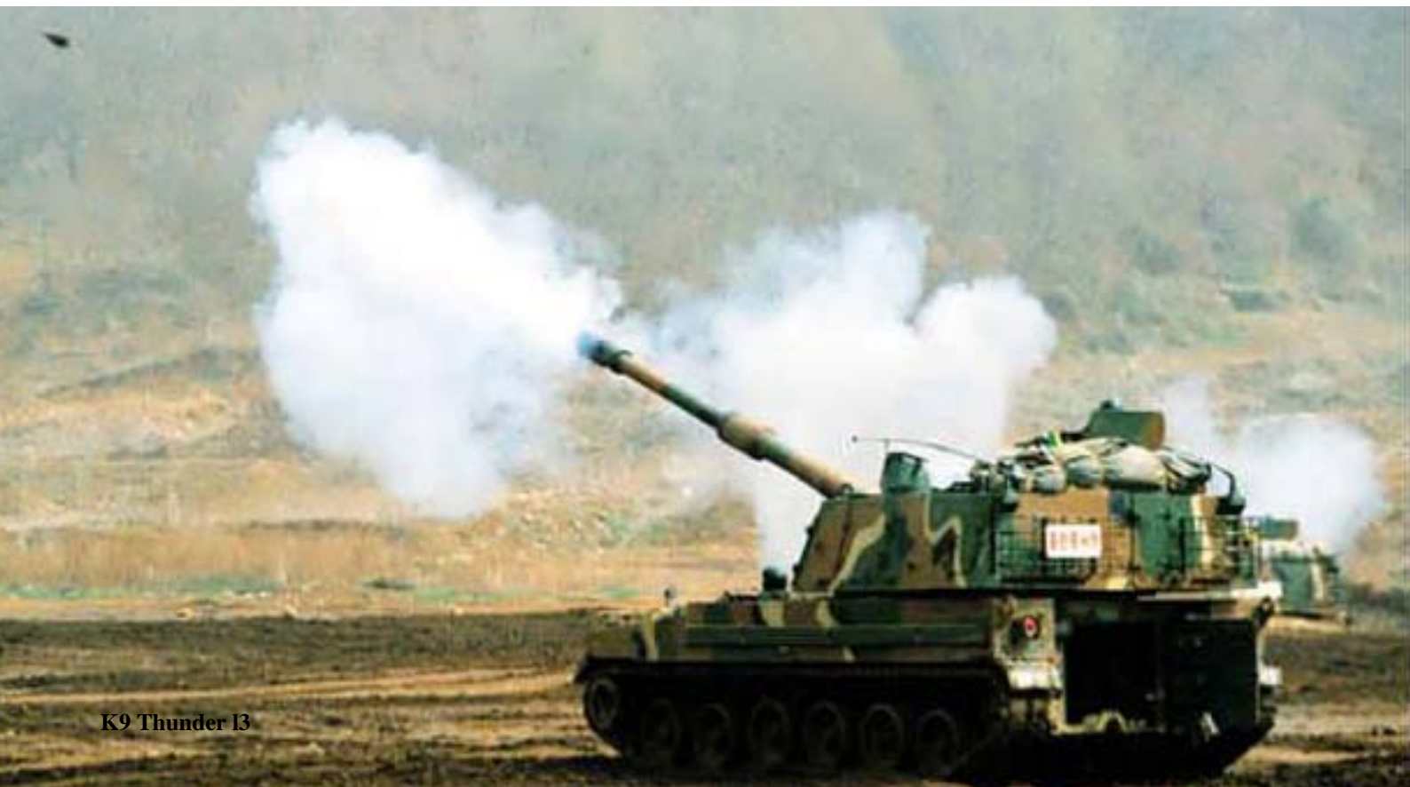
K9 Thunder 13

I dette projekt er der kun to udbudsgivere tilbage: RUAG byder