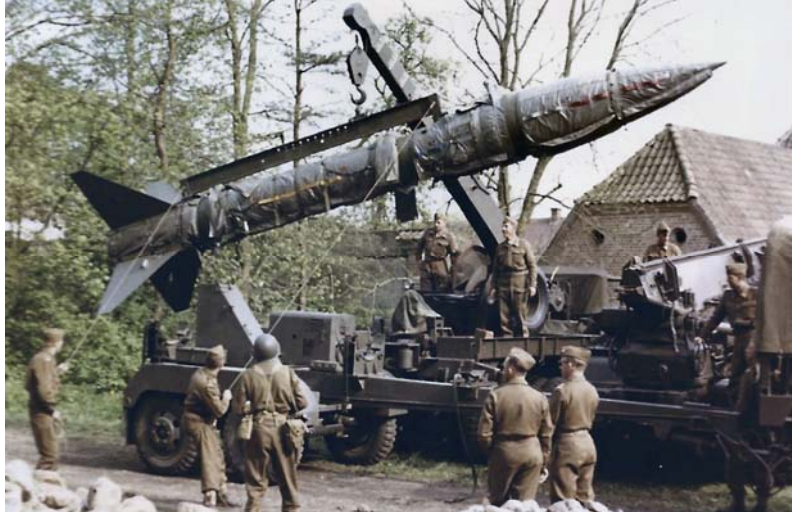
Honest John

det mildt. Det blev gennemført på en ualmindelig klodset facon, der skabte megen modvilje. Det var der så ikke noget at gøre ved, men det skabte i en længere årrække et meget dårligt klima i forbindelse med mønstringer og rådhedstjeneste for reserveofficerer, men det blev da vist nok bedre efter nogle år. Nu var der da også indtil flere regimentchefer i Sjælsmark, som var "født" i Holbæk, og det hjalp da lidt på sagen. Den 30. juli 1982 kl. 1530 blev flaget for sidste gang strøget fra den store flagstang på Holbæk Kaserne. En epoke på 68 år for SAR var slut. Holbæk var ikke længere garnisonsby. Der er dog den lille krølle at føje til denne kendsgerning, at Nordvestsjællands Feltartilleriforening, der er soldaterforening for SAR, er landets største soldaterforening for artillerister, og den samler