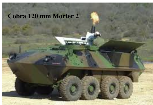
Cobra 120 mm Morter 2

ind med Cobra, der også er solgt til den svejsiske hær. Det andet system er Cardom 10 fra Elbit, der er en videreudvikling af den Cardom, der kendes fra den israelske hær og fra US Stryker Brigaden. Begge systemer er fuldt autonome og er dermed ikke afhængige af indmåling ved stillingsindtagelse, men kan "shoot and scoot" i samme høje tempo som artilleripjecerne – måske endda hurtigere. Der gennemføres verifikationstest og evaluering ultimo, ligesom anbefalingen fra FMI forventes at ligge klar til politisk afgørelse inden årsskiftet. Dette er med håbet om, at der kan indgås kontrakt i marts 2017. Om alt går vel, modtager vi nye artillerisystemer i 2019 og 120 mm mortersystemer i 2020.