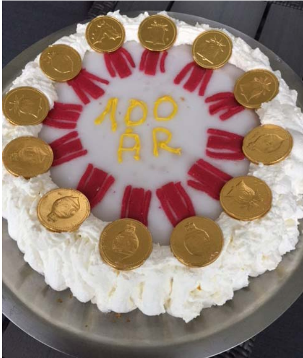
Foreningen har passeret 100 år i 2016. Lagkagen var i den anledning lavet af en af vore damer