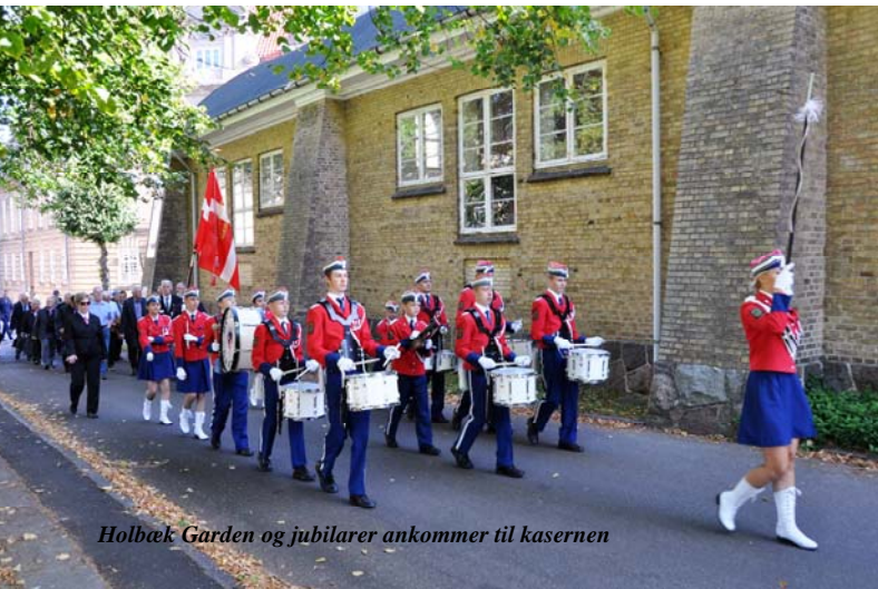
Holbæk Garden og jubilarer ankommer til kasernen