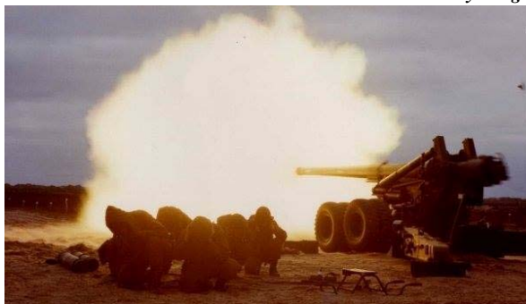
155 mm Kanon under direkte skydning

hvert år et stort antal gamle artillerister til årgangsjubilæum, så SAR er ikke helt død endnu.