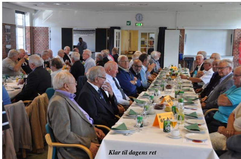
Klar til dagens ret

Lørdag i uge 38 er passeret igen, og det betyder at dette års ca. 60 veloplagte, feststemte og tidligere feltartillerister kunne tage hjem efter begivenheden i et godt humør, mætte og tilfredse. Et velafprøvet koncept, som medlemmerne synes at befinde sig godt med, og så er der vel ingen grund til at lave om på det. Bestyrelsen gør hvert år alle vores medlemmer opmærksomme på, at alle årgange er meget velkomne, men når nu arrangementet hedder, som det gør – År-