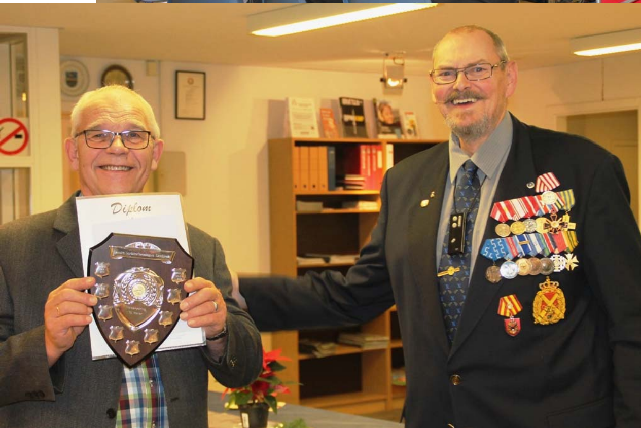
Holdleder/ Skydeleder med trofæet fra DSL Landspokalskydning.