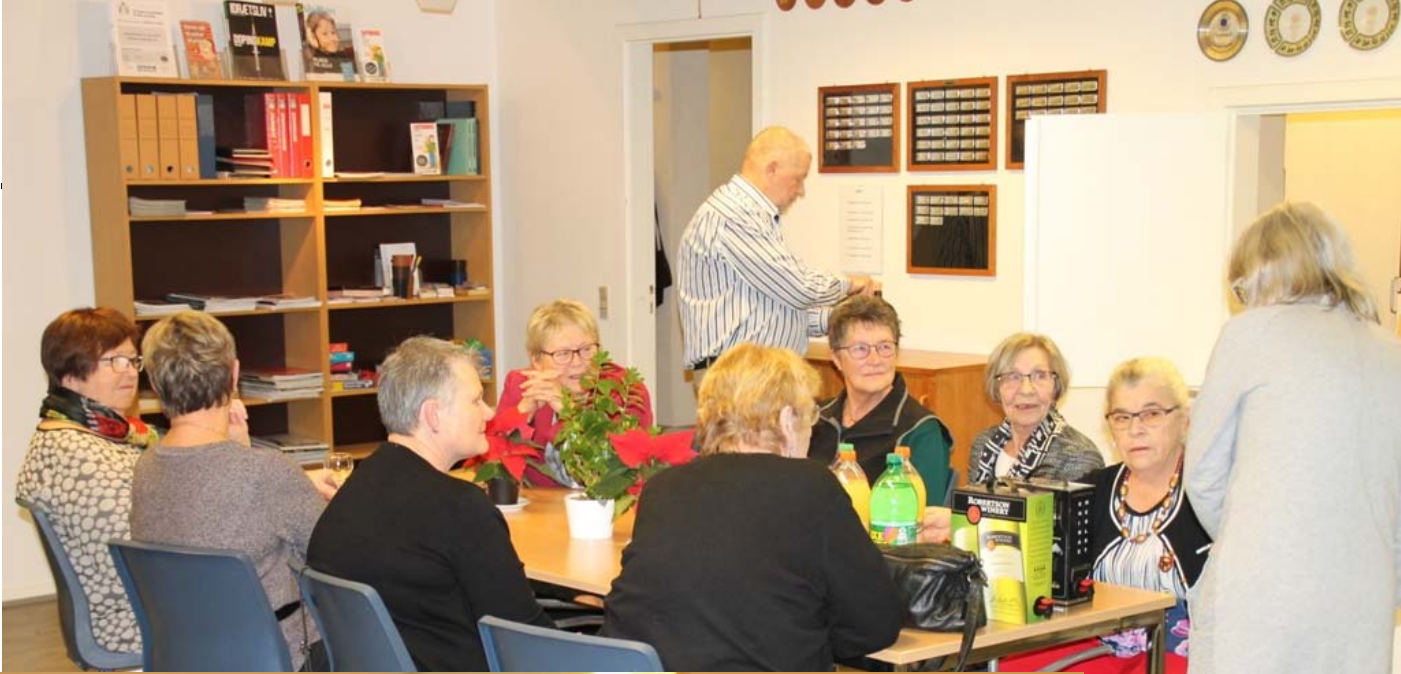
Pigerne hygger sig